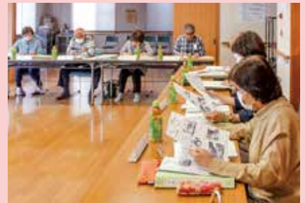
ふくし通信の掲載内容を検討

委員がサロンに出向いて取材。写真撮影から記事作成、印刷まで行ない、吉田町内の全戸に配布しました。7月には第2号を発行し、今後もサロンで楽しく過ごされている様子や地域福社会議の活動を発信します。