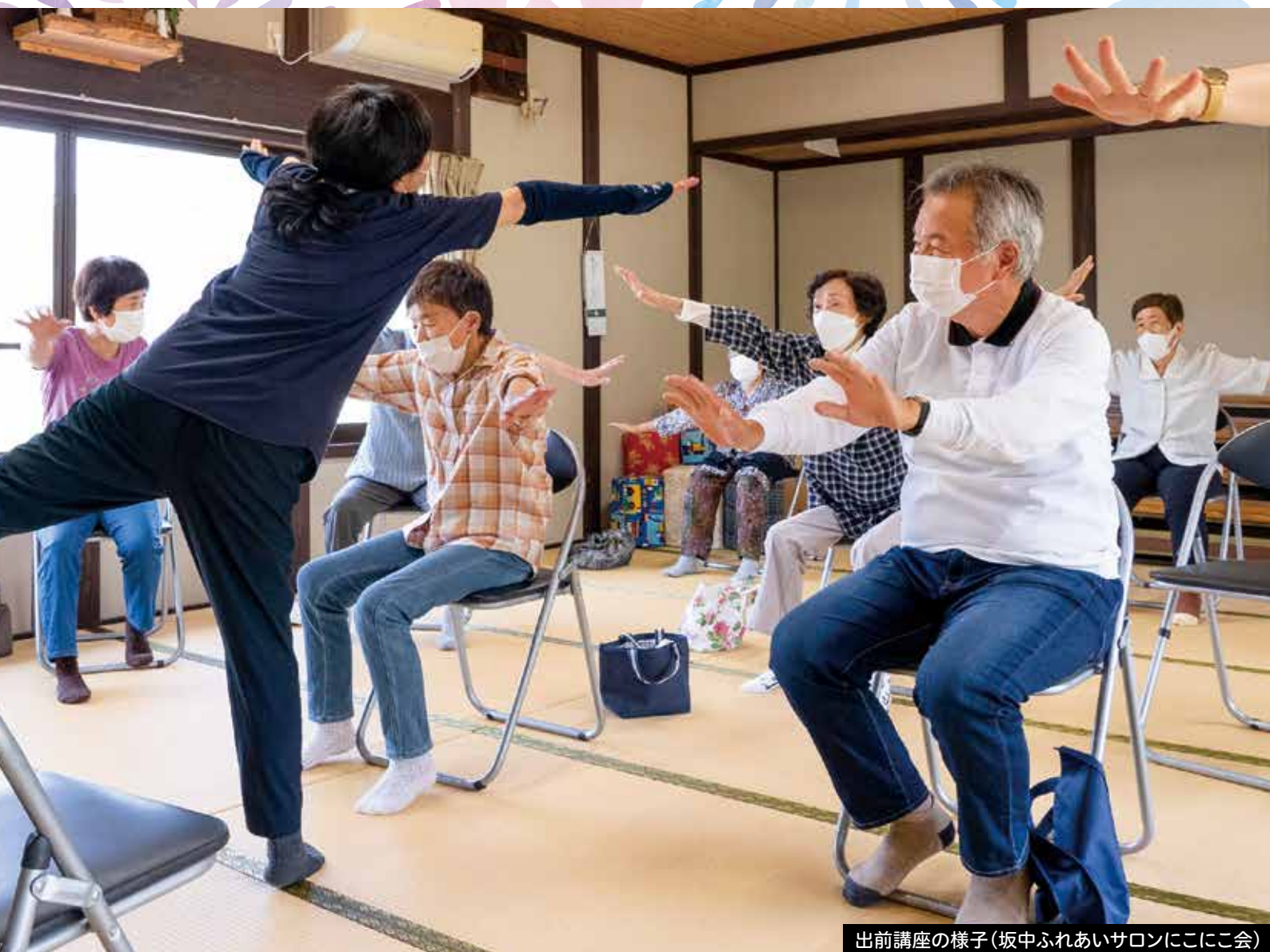
出前講座の様子(坂中ふれあいサロンにここ会)