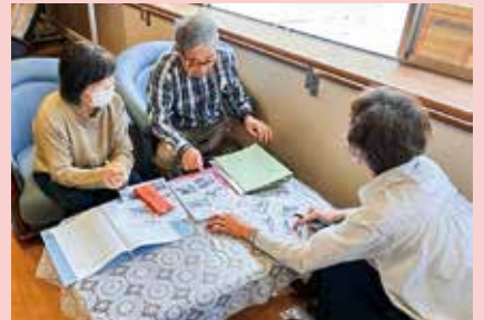
発行委員による編集会議の様子